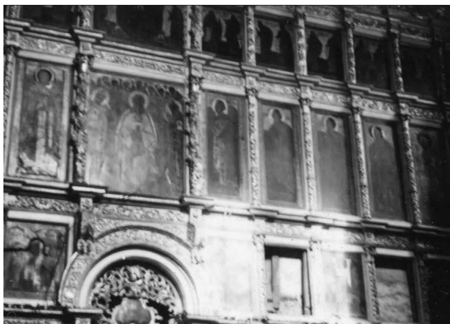
Ил. 5. Иконостас церкви Успения с Пароменья. Июнь 1944 г.